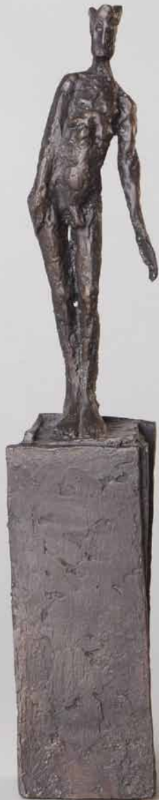
Kleiner Herrscher 2000 Bronze H: 25 cm