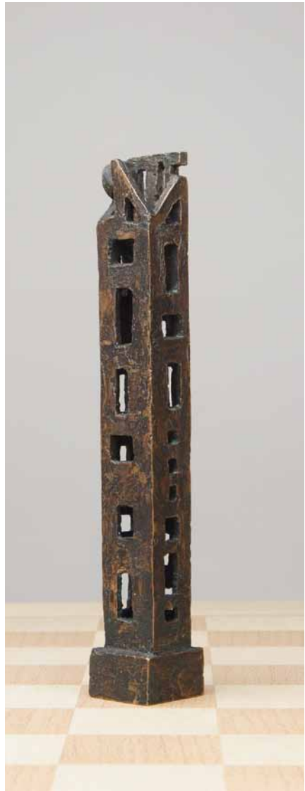
Turm 2006 Bronze H: 22 cm