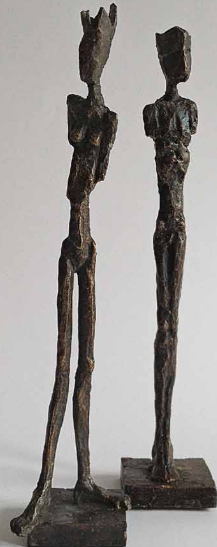
Ausgespielt 2012 Bronze H: 22 cm