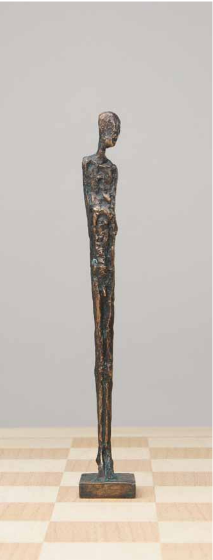
Bauer 2006 Bronze H: 22 cm