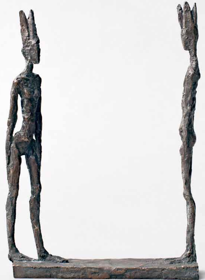
Schach! 2010 Bronze H: 12 cm