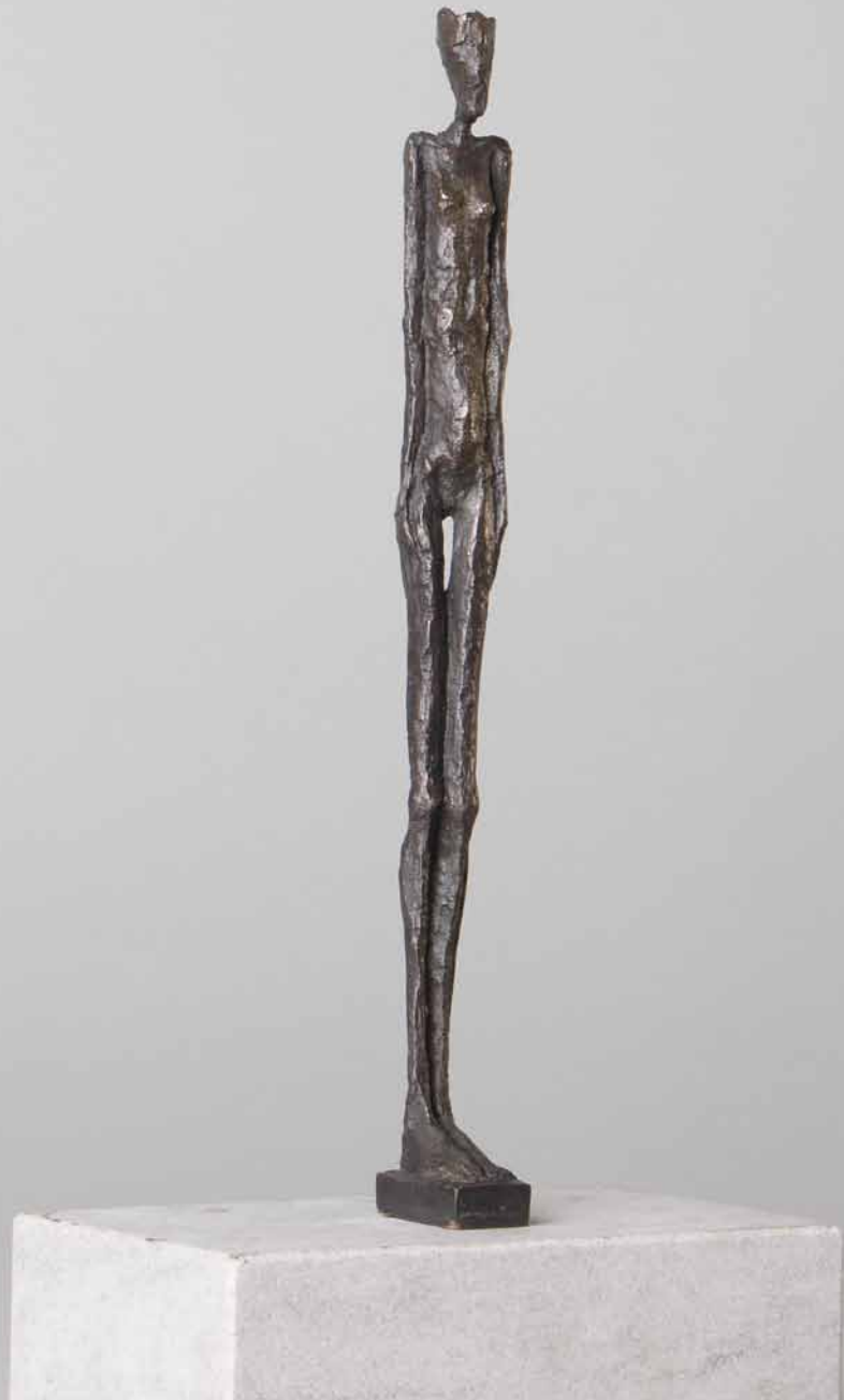
Königin 05 2005 Bronze H: 25 cm