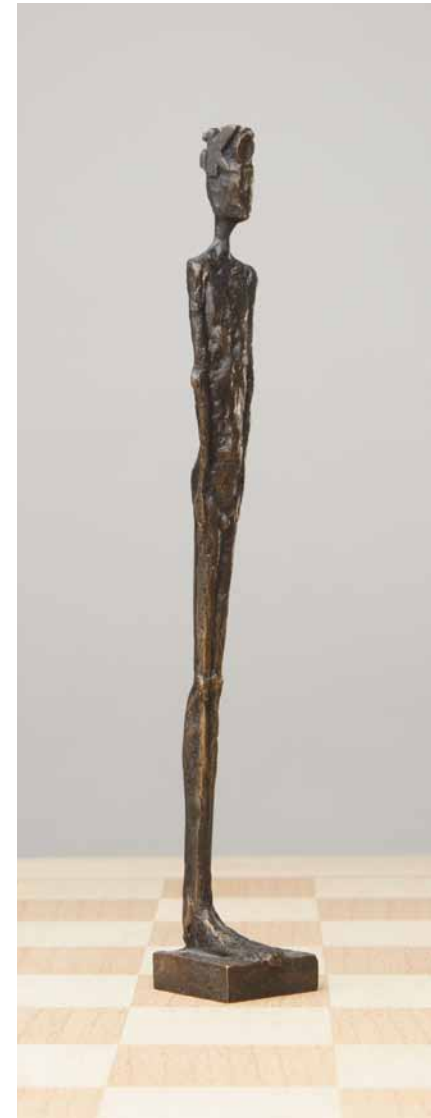
Dame 2006 Bronze H: 22 cm