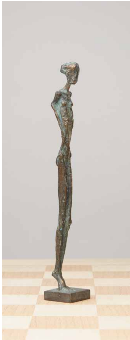
Springer 2006 Bronze H: 22 cm