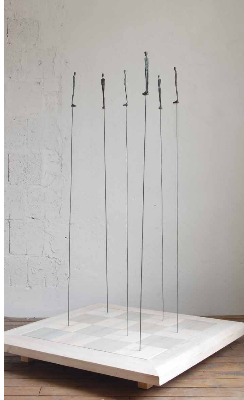
Schach-Objekt 2006 Bronze, Stahl, Holz H: 165 cm