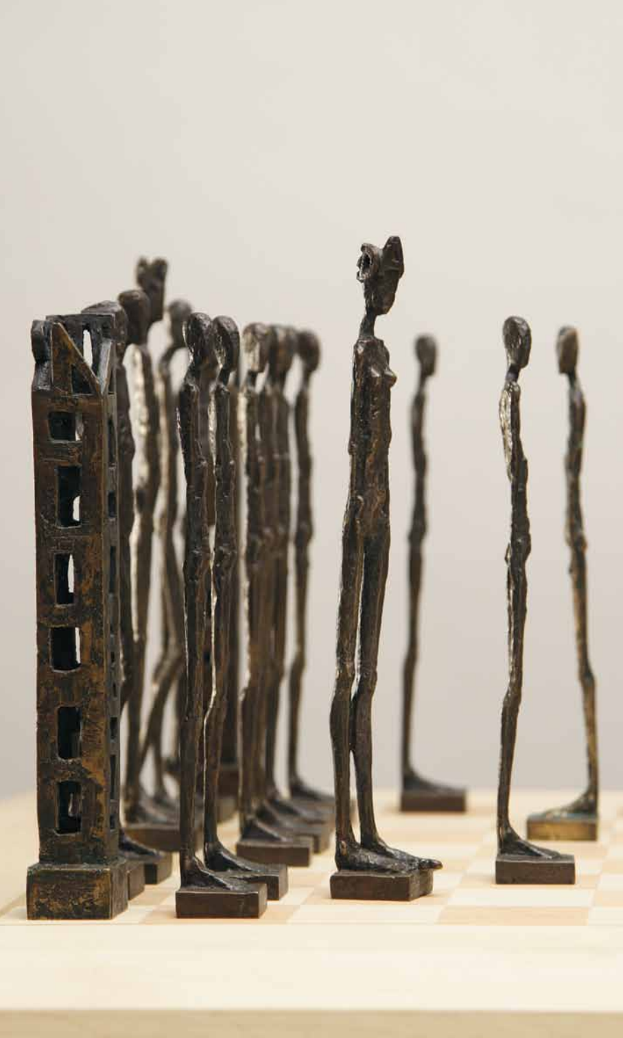
Schachspiel 2006 Bronze H: 22 cm