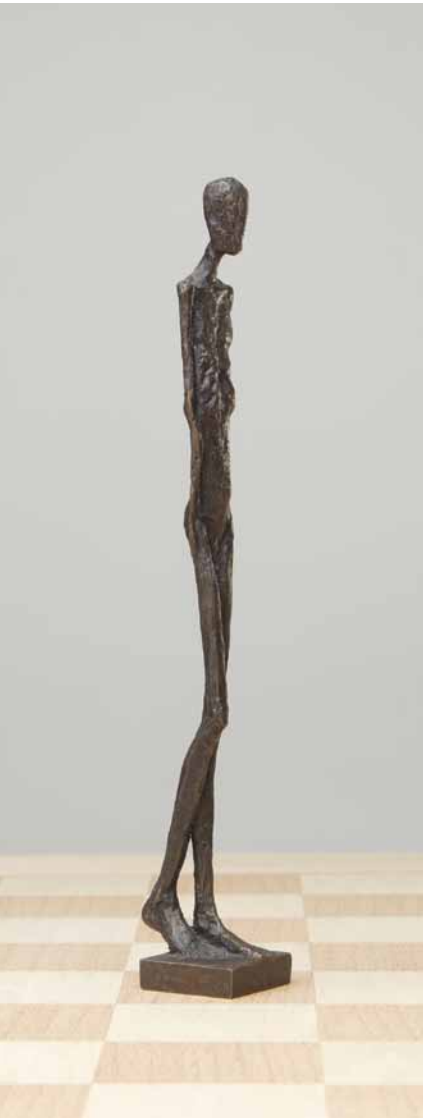
Läufer 2006 Bronze H: 22 cm