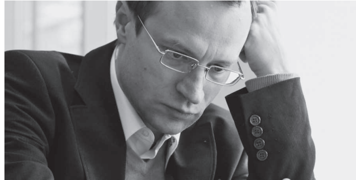
Sergei Tiviakov: äußerst erfolgreich mit giftigen Nebenvarianten

B) Am häufigsten wird 4...e6 gespielt (was Zugumstellung zu Rossolimo 3...e6 4.♗c3 ♗d4 ist), worauf am genauesten 5.0-0 a6 6.♙d3 folgt. Nun ist vielleicht 6...♗c6 der sicherste Weg,