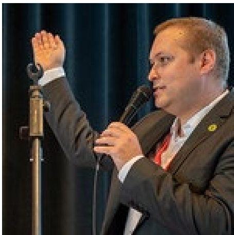
Laurent Freyd, Leiter der FIDE-Schiedsrichterkommission und Hauptschiedsrichter des Internationalen Festivals von Biel.